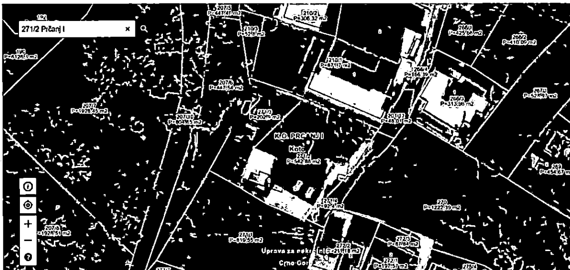
Sl. 1- Izvod sa Geoportala ( https://geoportal.co.me )

u vezi Vašeg zahtjeva za izdavanje Urbanističko- tehničkih uslova, br. 03-333/23-20816-1, obavještavamo Vas da smo neposrednim uvidom u prikaz geoprostornih podataka Uprave za katastar i državnu imovinu (Geoportal), evidentirali postojanje objekata, koji nisu upisani u Listu nepokretnosti br. 943 KO Prčanj I, na lokaciji koju čini kat.parc. 271/2 KO Prčanj I. Shodno navedenom, za predmetnu lokaciju nije moguće izdati Urbanističko- tehničke uslove, već je neophodno riješiti prethodno pitanje.